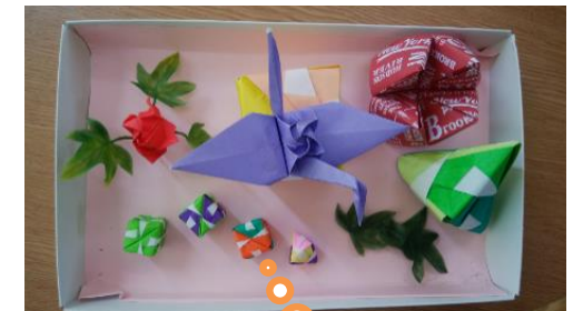
宗二の折り紙名人の作品です。

中学生時代に一番読んだ思い出の本です。主人公の中学生の女の子と“西の魔女”と呼ばれるおばあちゃんの生活が描かれているので、同じ中学生の時期に是非読んでほしいです。きっと考えさせられることや気づかされることがあると思います。読んでみて下さい！